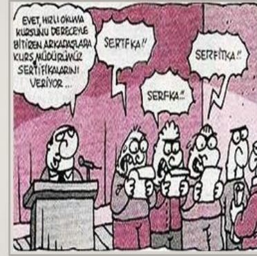
Karikatür sahibi: Yigit Özgür