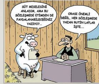
Karikatür sahibi: Selçuk Erdem

Bunların içinde bilgi edinmek, okumakla elde edilen en önemli sonuçlardan biridir. Okumak araştıran, sorgulayan insan için temel bir gereksinimdir.